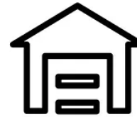
Garage, berging of bijkeuken