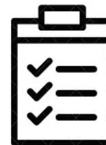
Overige klusjes te doen